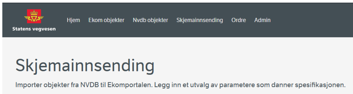
Figur 3: Skjemainnsending fra NVDB til Ekomportalen

Er skjema hvor du kan importere objekter fra NVDB til Ekomportalen. Skjemaet tilbyr forskjellige filtreringsvalg basert på hvilket vegobjekt du har valgt og hvilke roller du har i NVDB. Du kan filtrere på